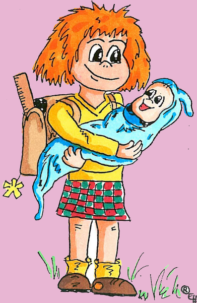
Zeichnungen: Ellen Habben

Die Gespräche unterliegen selbstverständlich der Schweigepflicht.