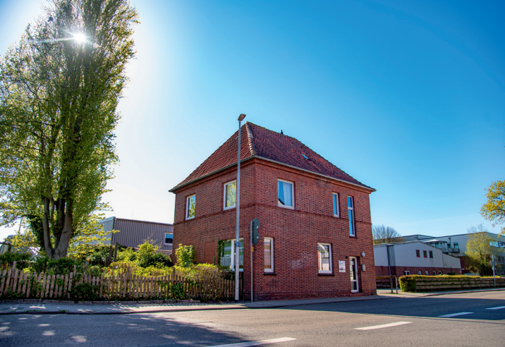
Das Wiemersche Haus, Große Mühlenstr. 26, 26506 Norden

Die Kontaktstelle Wiemersches Haus ist ein offenes Angebot für Menschen mit unterschiedlichen Problemen, psychischen Belastungen oder Erkrankungen sowie deren Angehörigen und Freunden.